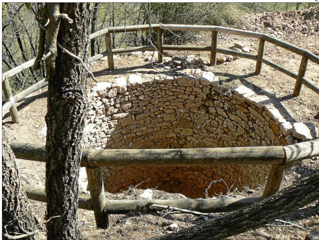
Estat actual del pou de glaç de Fals (Bages), al qual falta la volta de coberta i la part superior

«La majoria estan abandonats», explica Fàbrega d'un element patrimonial poc cuidat per les administracions. L'excepció a aquesta realitat és el pou del Portal de Solsona, un exemplar de grans dimensions museïtzat i integrat al nucli urbà de la localitat. En canvi, per trobar el de Malagarriga (Pinós), l'autor explica que en algun tram es va posar a quatre grapes per franquejar l'espessa vegetació i localitzar-ne les restes. «Tant de bo el llibre servís per sensibilitzar ajuntaments i col·lectius. Potser ara no hi ha diners per museïtzar o restaurar, però potser es pot evitar que es perdin per sempre», afirma.